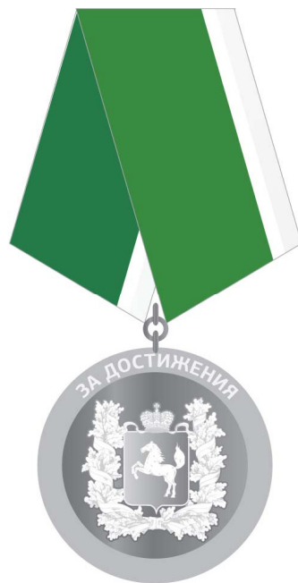
Рисунок медали «За достижения»

УТВЕРЖДЕН постановлением Губернатора Томской области от 01.04.2013 № 36