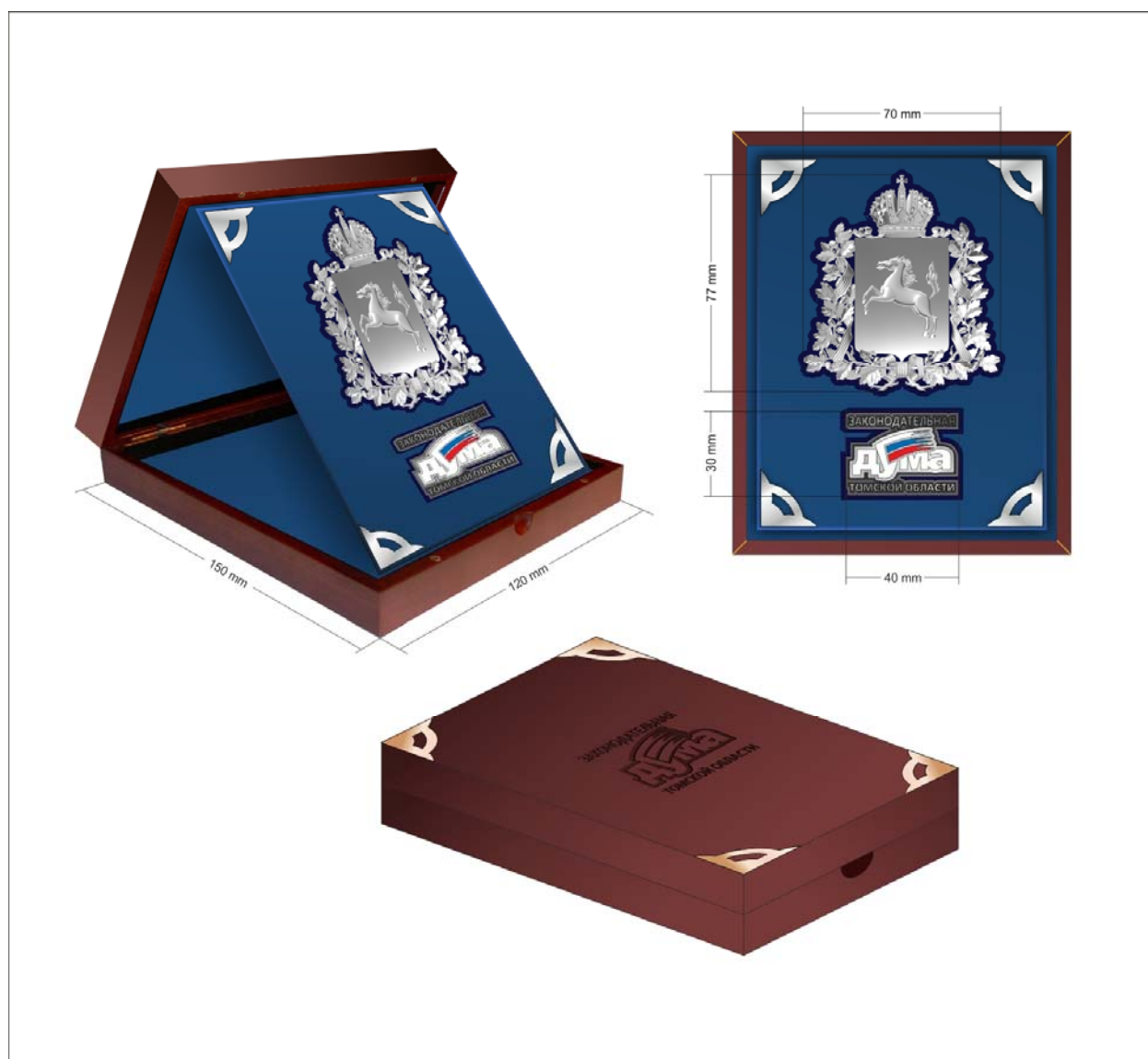
РИСУНОК настольного варианта нагрудного знака к Почетной грамоте Законодательной Думы Томской области