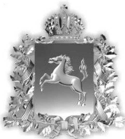
РИСУНОК нагрудного знака к Почетной грамоте Законодательной Думы Томской области