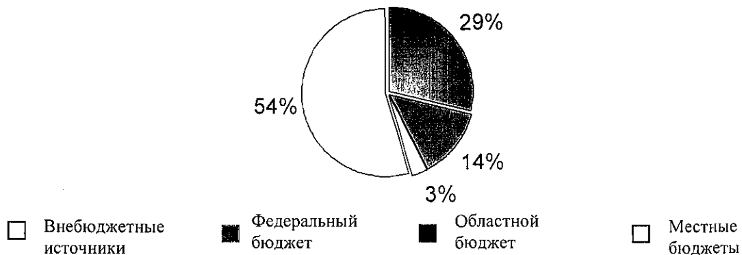
Рисунок 1. Структура финансирования программ в 2011 году по источникам (%)

В областном бюджете на реализацию программ в 2011 году объем бюджетных ассигнований составляет 2 749 218,4 тыс. рублей , из них по приложению 13 к Закону Томской области от 28.12.2010 №327-ОЗ (далее – приложение 13) - 2 673 218,4 тыс. рублей .