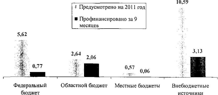
Рисунок 2. Финансирование долгосрочных целевых программ за 9 месяцев 2011 года (млрд. руб.)

Основные причины низкого уровня финансирования программ по итогам 9 месяцев 2011 года: