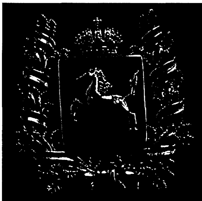
РИСУНОК памятного знака Законодательной Думы Томской области «Герб Томской области»